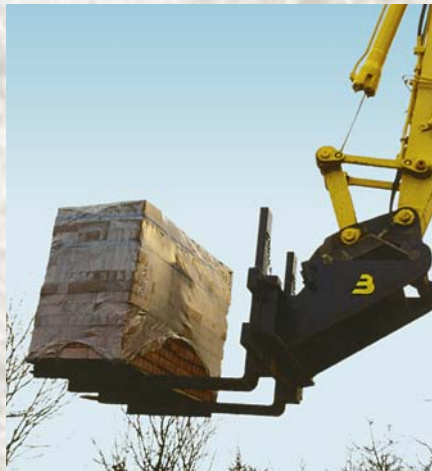
Palletvorken 500-10.000 kg.

Abbruchschaufeln Demolition forks Godets de démolition