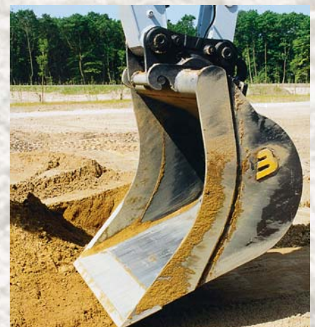
Slotenbakken 50-10.000 l.