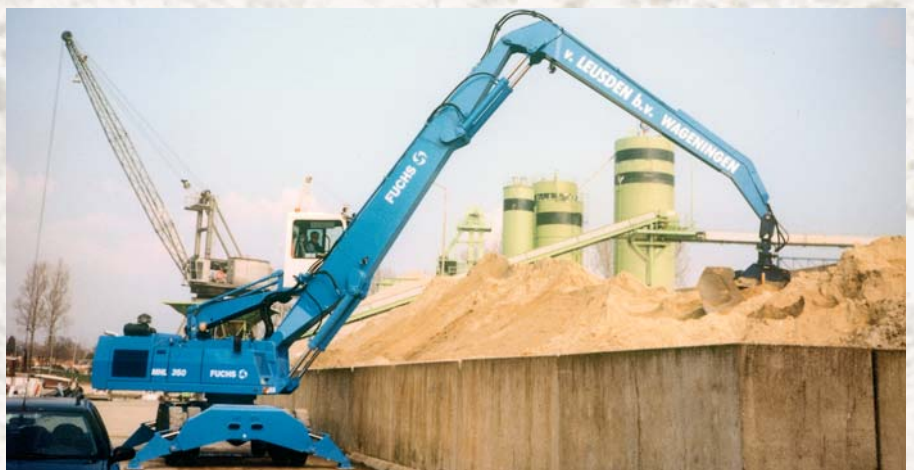
Beco Boforce super long fronts max. 30 m.

Abbruch-Sortiergreifer Demolition-Sorting grabs Pince de tri/démolition