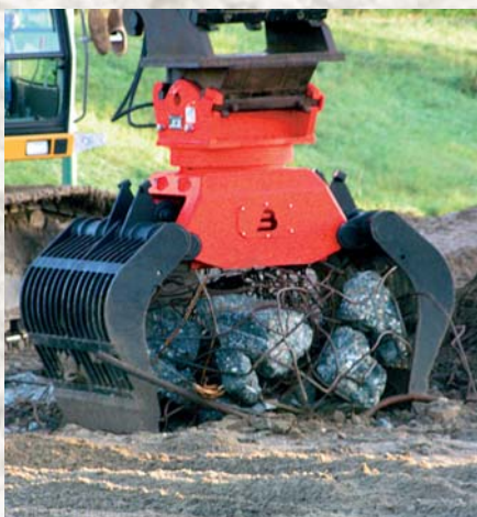
Sloop-Sorteergrijpers 50-1.000 l.

Abbruch-Sortiergreifer Demolition-Sorting grabs Pince de tri/démolition