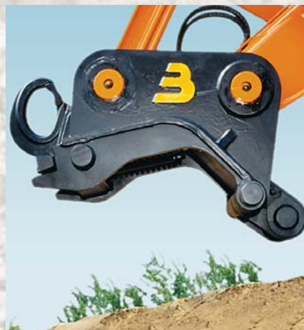
Connectoren type CW 0-CW 5