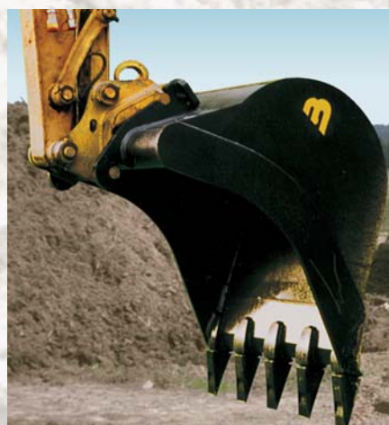
Dieplepels 50-10.000 l.